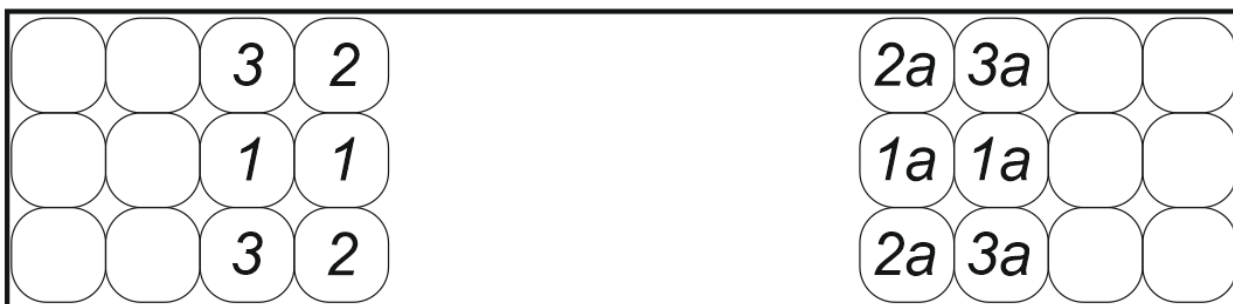
Рис. 1. Верхний ярус.

1. Разгрузку начинать с верхнего яруса (рис. 1) двухконцевыми чалками в следующем порядке: №1-№1 или №1а-№1а; №2-№2; или №2а-№2а; №3-№3 или №3а-№3а. и т.д.